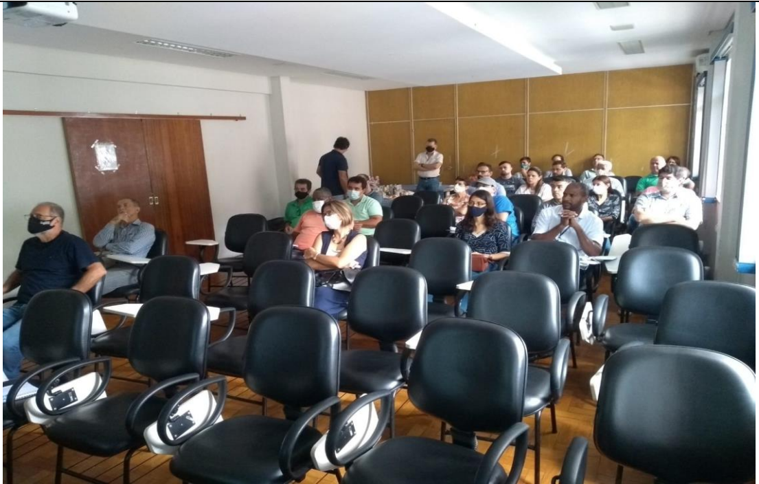
Foto reunião com membros do CBH-PS dia 05 de abril de 2022, 10h00

COMITÊ DAS BACIAS HIDROGRÁFICAS DO RIO PARAÍBA DO SUL Largo Santa Luzia nº 25 - Taubaté-SP - CEP 12010-510 Fones: (12) 3632-0100 e (12) 3631-6138 E-mail: cbh-ps@comiteps.sp.gov.br