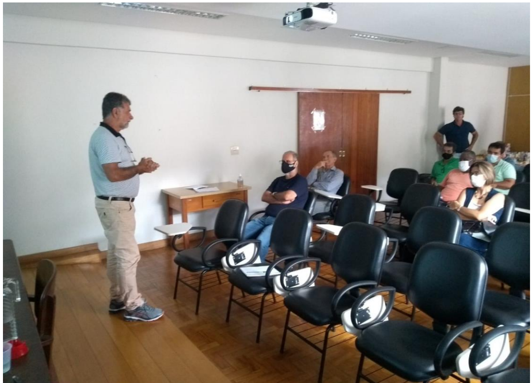
Foto reunião com membros do CBH-PS dia 05 de abril de 2022, 10h00