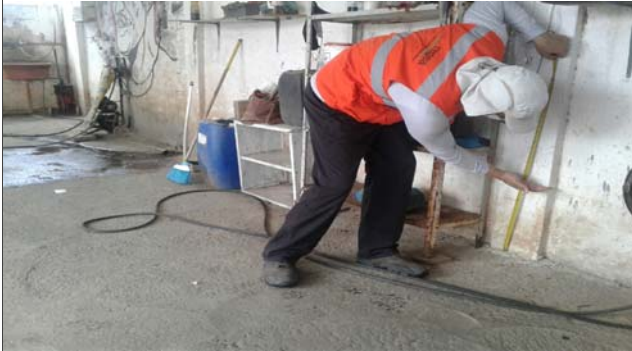
Foto: 1641469995569.jpg ID: 12 Detalhe para marca de água,