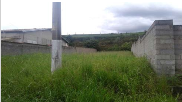
Foto: 1641401000576.jpg ID: 43 Visão geral do setor, Talude de corte com solo exposto