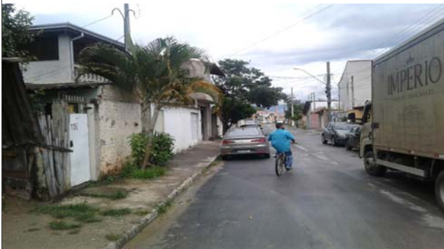
Foto: 1641470997740.jpg ID: 13 Visão geral da área