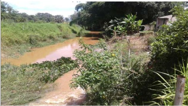
Foto: 1641475001171.jpg ID: 43 Visão geral da drenagem,