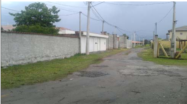
Foto: 1641404594332.jpg ID: 13 Visão geral da área, Imóveis afetados pelo processo