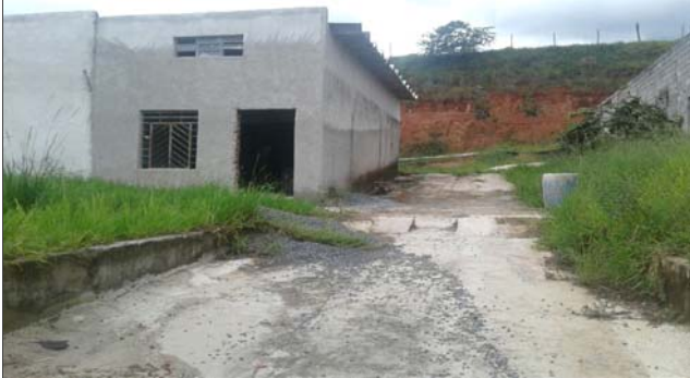
Foto: 1641399942215.jpg ID: 41 Talude de corte com solo exposto