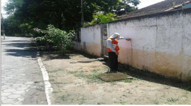
Foto: 1641474901613.jpg ID: 41 Detalhe para marca de água, Marca d'água de 1 m