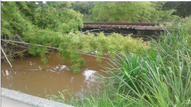
Foto: 1641404798133.jpg ID: 14 Visão geral da drenagem,