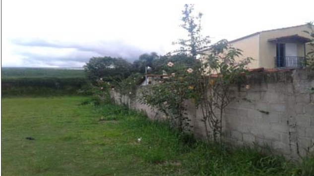
Foto: 1641401473201.jpg ID: 44 Moradia sujeita a risco de escorregamento