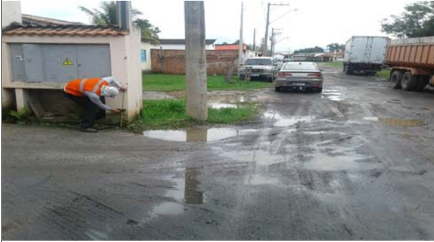
Foto: 1641472315669.jpg ID: 32 Detalhe para marca de água