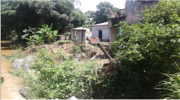
Foto: 1641474953651.jpg ID: 42 Imóveis afetados pelo processo