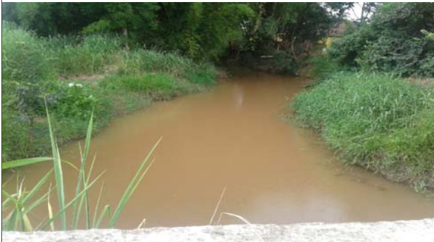
Foto: 1641404840824.jpg ID: 15 Visão geral da drenagem,