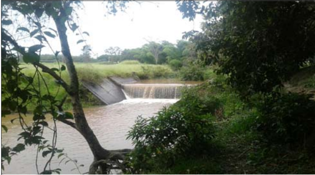
Foto: 1641404507078.jpg ID: 11 detalhe para intervenções no canal, Barragem