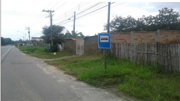
Foto: 1641400121604.jpg ID: 42 Visão geral do setor