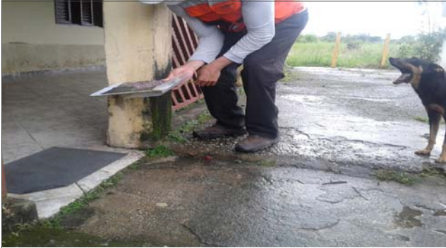
Foto: 1641468702095.jpg ID: 11 Detalhe para nível de atingimento