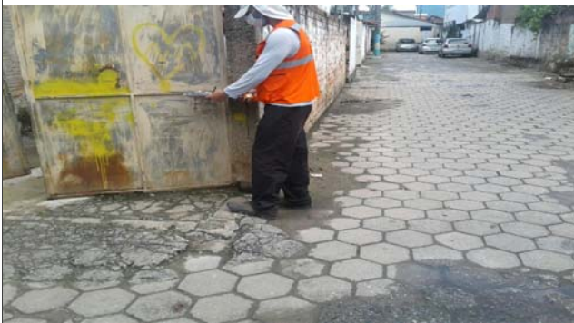
Foto: 1641475048566.jpg ID: 44 Detalhe para nível de atingimento