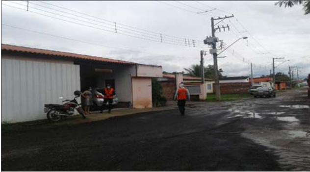
ID: 31 Visão geral da área