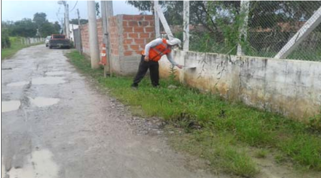
Foto: 1641404757855.jpg ID: 12 Detalhe para marca de água,